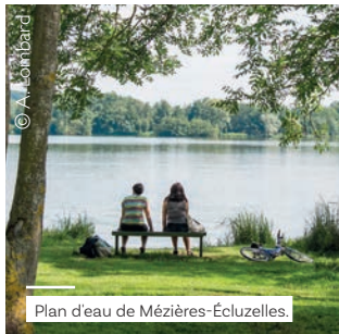
Plan d'eau de Mézières-Écluzelles.