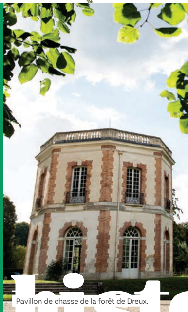
Pavillon de chasse de la forêt de Dreux.