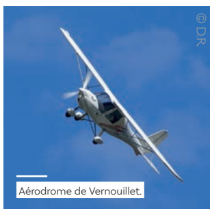
Aérodrome de Vernouillet.