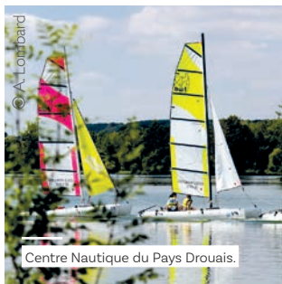
Centre Nautique du Pays Drouais.