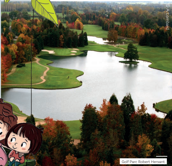
Golf Parc Robert Hersant