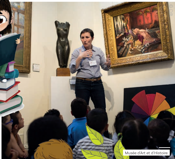
Musée d'Art et d'Histoire.

Plusieurs lieux d'art et de culture sauront combler les attentes des petits et grands investigateurs !