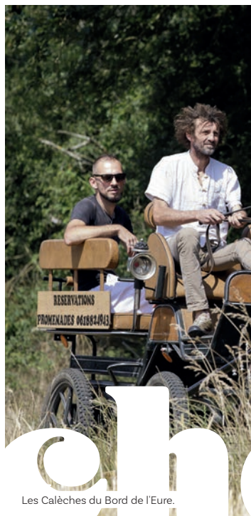
Les Calèches du Bord de l'Eure.

Avec près de 700 000 licenciés, l'équitation se classe en 3 ème position des disciplines. En France, c'est le premier des sports féminins.