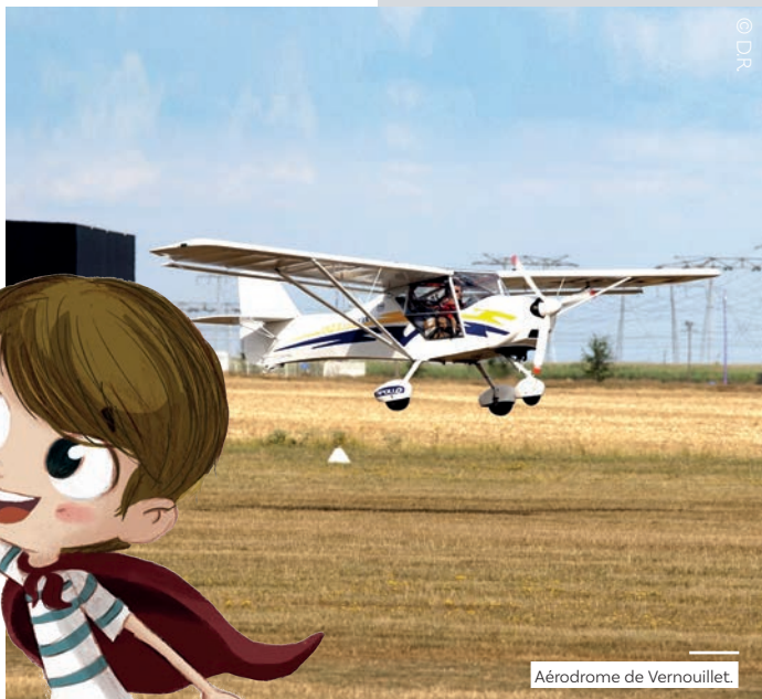
Aérodrome de Vernouillet.

L'ULM (Planeur ultra-léger motorisé) vole en moyenne entre 1 000 et 3 000 pieds (300 et 900 mètres) de hauteur.