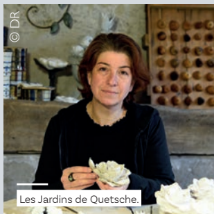
Les Jardins de Quetsche.

Faites parler la créativité qui est en vous et laissez vous surprendre par des œuvres originales et authentiques.