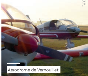
Aérodrome de Vernouillet.