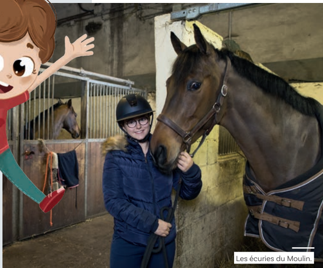
Les écuries du Moulin.

Tous en selle ou en calèche pour flâner sur les chemins les plus bucoliques et verdoyants du territoire, à la croisée des plaines et forêts !